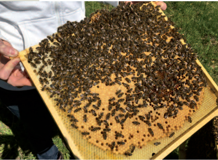
Großes Brutnest auf einer frischen Wabe Mitte April.

volle Größe zu setzen. Wir arbeiten zu der Zeit mit sechs bis sieben Waben Einheitsmaß-Jumbo bzw. neun Waben Einheitsmaß und einem Trennschied.