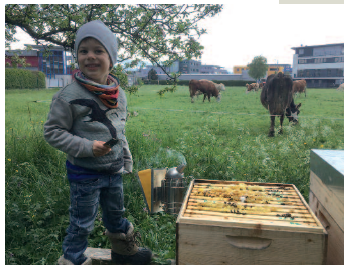
Imkernachwuchs bei der Kontrolle Anfang April.

zum Hals in den Völkern. Hautnah, ohne Schutzkleidung! Wir teilen die Klassen in zwei Gruppen auf, zwei Imker arbeiten jeweils mit einer Gruppe an zwei Völkern. Die Kinder bekommen vorab ein Infoblatt und sind gut vorbereitet (siehe Download). So kommen wir pro Saison auf nur 1–2 Bienenstiche, aber die Kinder sprühen vor Begeisterung. Den bemalten Bienenstock stellen wir an öffentlich zugänglichen Bienenständen auf, die Kinder können „ihr Bienenvolk“ jederzeit besuchen. Das machen sie vor lauter Begeisterung oft noch am gleichen Tag mit den Eltern – und auch in den Monaten danach. Das ist in diesem Umfang der Stadt möglich, das ist sicher auch in eurer Gemeinde/Stadt möglich. Bitte nutzt den Tag des offenen Bienenstocks selbst für eine (kleine) Veranstaltung!